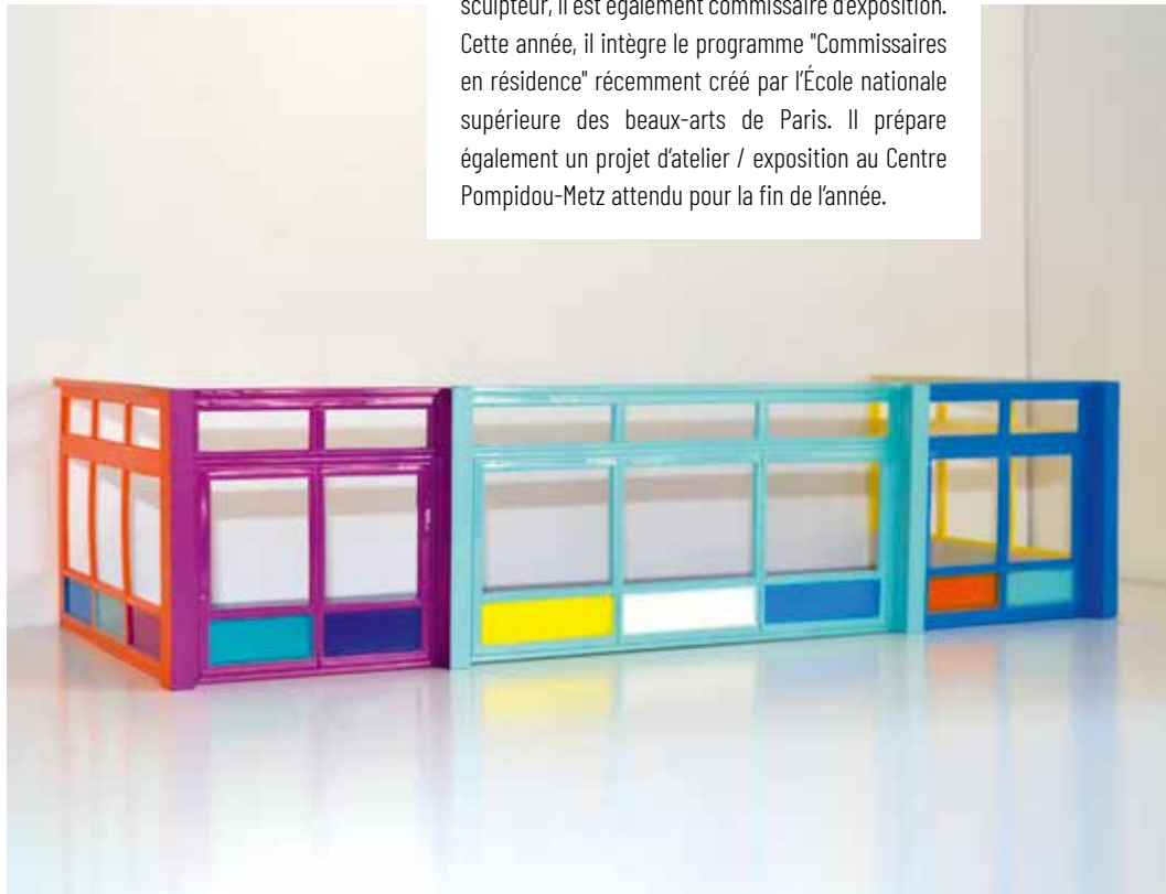
Véranda "Bahamas", prototype de la collection "Code couleurs", peinture de carrosserie sur maquette en résine, impression 3D, 2020