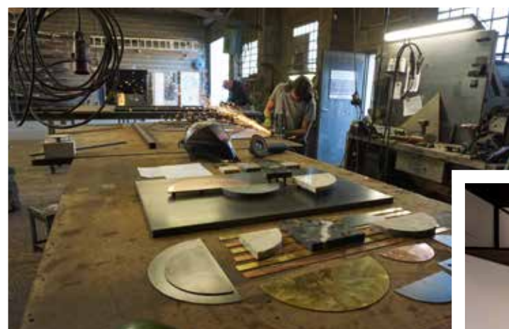
Poignée "TanGram" , prototype de la collection "Comme des bijoux", assemblage de pièces en marbre, pierre, et métal.